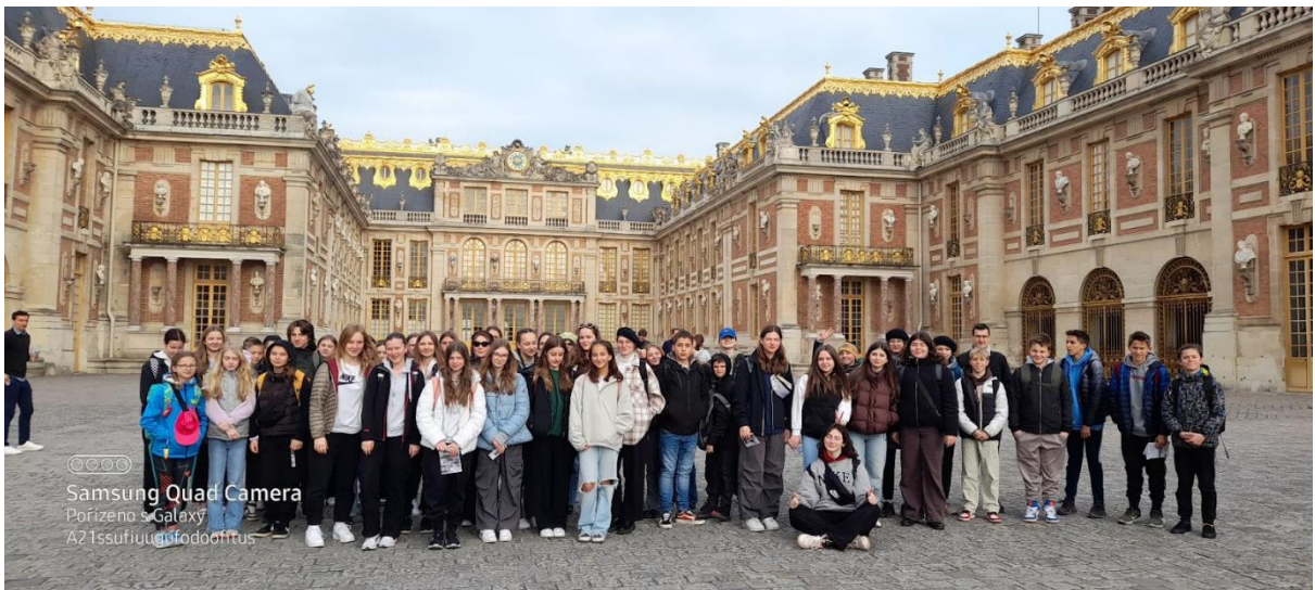
Před palácem ve Versailles