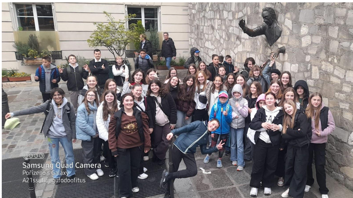
Potřesení s Mužem procházejícím zdí