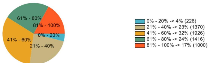
Tabulka detailních výsledků