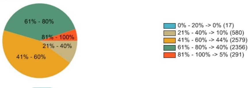
Tabulka detailních výsledků