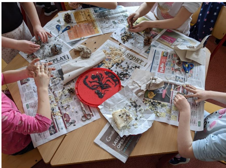
Připravujeme různá krmítka pro ptáčky

Všichni se svého úkolu zhostili s velkou chutí a bylo vidět, že mají přírodu moc rádi. Děkujeme.