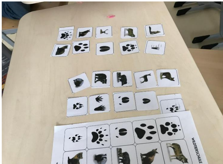
Návštěva u krmelce a rozeznávání stop